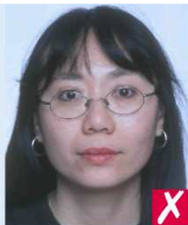
Оправа на глазах