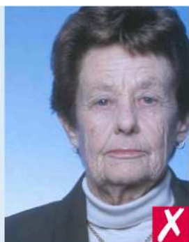
Не по центру