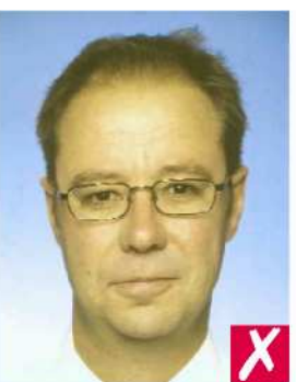
Не натуральный цвет лица