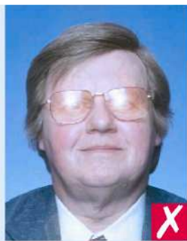
Блики на очках