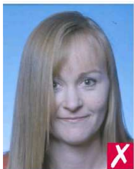
Волосы на лице