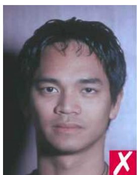
Тень на фоне