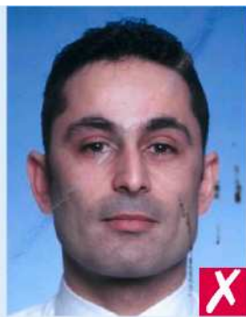
Помечены чернилами /помяты