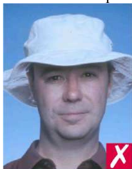
В головном уборе