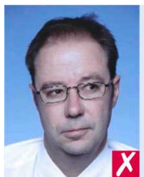
Смотрит в сторону