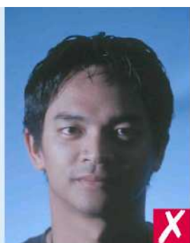
Тень на лице