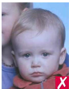
Посторонние люди и предметы на фото