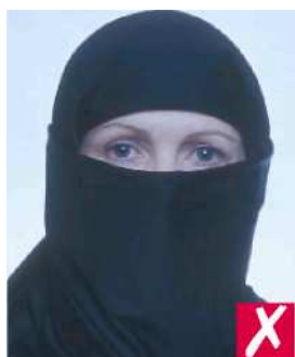
Лицо закрыто платком