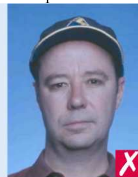
В головном уборе